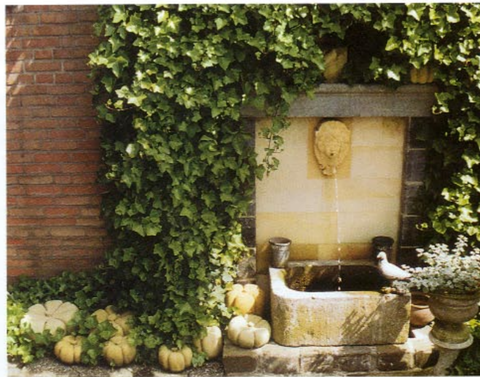
BOVEN | Waterspuwer van mergel, geflankeerd door zelfgemaakte pompoenen van mergel.