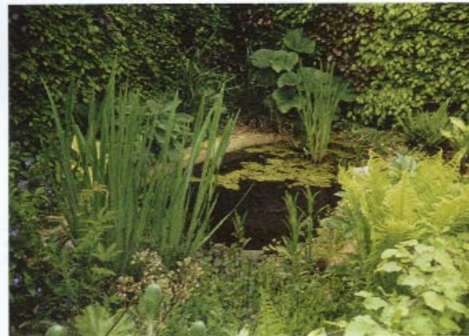
BOVEN | Kikkers en salamanders bewonen de poel en het moerasje in de grote-bladerentuin.